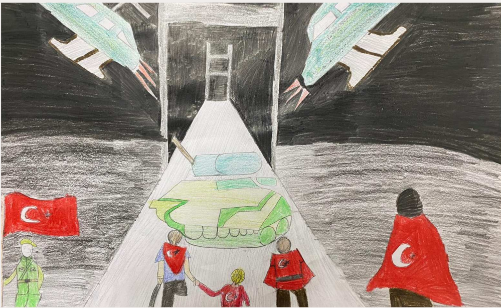
Gamze COŞKUN 8/A